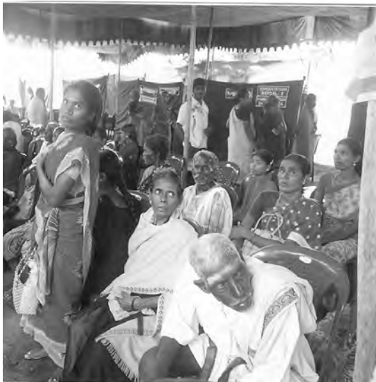
Foto: bezoekers Medical camp