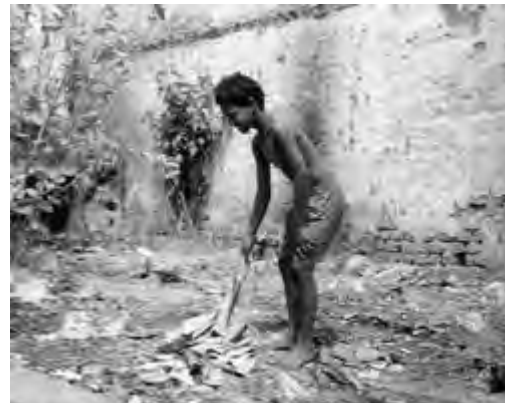
Foto: Een jongetje pikt kleren op in Bangalore

Bangalore is een rijke, westerse, snel ontwikkelende ICT-stad maar ook een stad vol slums, sloppenwijken waarin lepramensen, ex-prostituees, bedelaars, weduwen en wezen proberen te overleven. In de meeste gevallen zijn ze afhankelijk van wat andere mensen achterlaten op straat.