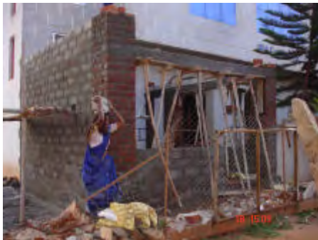
Foto: boekwinkel in aanbouw

In Kovaipudur is het idee ontstaan voor een Christelijke boekwinkel. Deze komt tot stand via giften. Inmiddels is de bouw gestart.