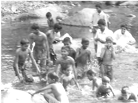
Foto: weesjongens in het water

Ook dit jaar zijn de weeskinderen dankzij uw gift op vakantie geweest. Het was voor de leiding weer een hele onderneming om zoveel eten, slaappleaatsen en goede verzorging te bieden tijdens die dagen. Maar voor de kinderen is het een groot feest als ze weer één van hun favoriete activiteiten mogen gaan doen: zwemmen!