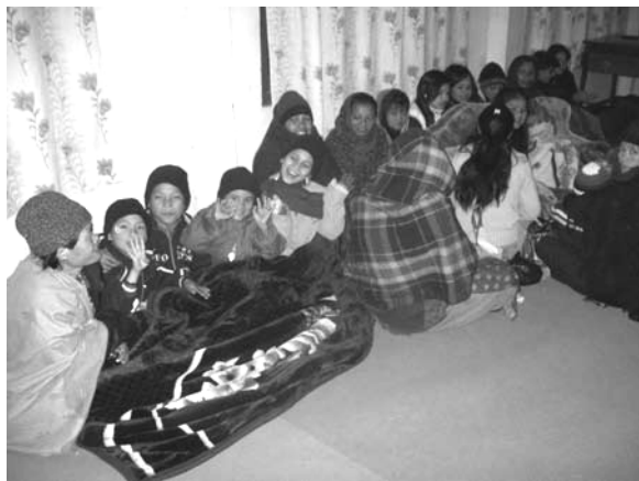
Nachtdienst in Nepal

Na een 32 uur durende reis zijn we eind december in winters Nepal aangekomen. De volgende dag, oudejaarsavond 2009, hebben we een nachtdienst gehouden in een zaal zonder verwarming, met dikke dekens en mutsen.