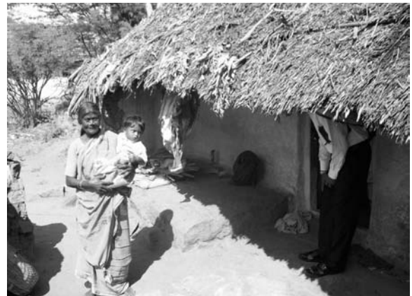
Een dorpsbewoner bezoekt de Village Ministries