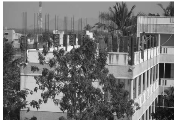
De school krijgt een extra etage

In de vorige brief vroegen wij u om hulp voor een extra etage op de school. Deze was dringend nodig vanwege de te grote klassen en werd door de onderwijsinspectie vereist. Eind vorig jaar is een sponsor in onze vriendenkring gekomen, die de totale kosten van de vijf nieuwe leslokalen op zich neemt. Op dit moment is de bouw in volle gang en we verwachten dat de nieuwe etage in juli/augustus klaar is.