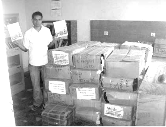
De stripboeken zijn aangekomen

Eind januari zijn 5.000 exemplaren van het stripboek "Hij leefde onder ons" in Kathmandu aangekomen, na lang oponthoud bij de grens.