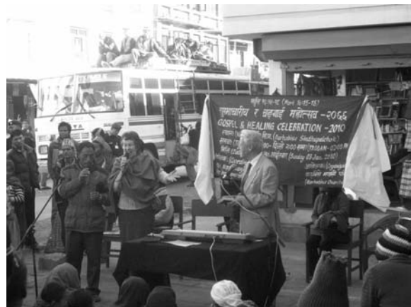
Openluchtbijeenkomst in Nepal

Net als vorig jaar hebben we tijdens een openluchtbijeenkomst gesproken. Dit keer vond de bijeenkomst plaats bij de grens met Tibet. Velen werden aangeraakt en genezen. Een bus met mensen bleef zelfs een half uur wachten om te kijken en te luisteren. Ook deden mensen de ramen van hun huizen speciaal hiervoor open.