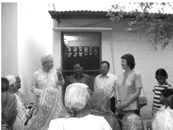
Opening van de gebedsruimte

Bij het weduwenhuis hebben we een kleine gebedsruimte geopend.