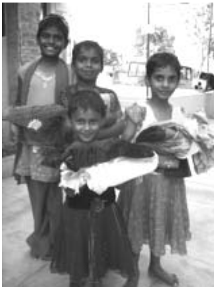
De weeskinderen met nieuwe kleding

Het kerstfeest in Periyampatti is door ruim 4.900 mensen uit de omliggende dorpen bezocht. En bij de andere vijf projecten kwamen nog eens zo'n 2.000 mensen. De hele dag was er een vol programma met o.a. muziek, zang, het Evangelie, dansjes en sketches. Dankzij een groot aantal vrijwilligers die meehielpen bij de dagenlange voorbereidingen, werd het een blij en gezegend Kerstfeest met als afsluiting een eenvoudig liefdemaal. Met dank aan onze sponsors in Nederland konden wij de kosten van het kerstfeest volledig betalen. De kerstactie van 2009 bracht maar liefst € 7.903 op!