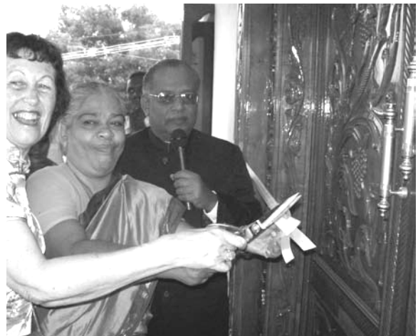
Opening van een nieuwe kerk

Tijdens ons bezoek mochten we vijf nieuwe kerken openen en tot de jonge gemeenten spreken.