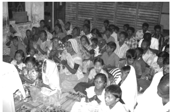
Ontmoeting met vluchtelingen

In de vorige nieuwsbrief schreven we over de christelijke vluchtelingen uit de provincie Orissa. We hebben hen in een samenkomst kunnen bemoedigen. De vervolgingen hebben hen onbeschrijfelijk leed bezorgd. Ondanks dat was er blijdschap en moed om door te gaan en van de Heer te getuigen.