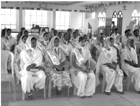
Studentes van de Bijbelschool

De Bijbelschool die twee jaar geleden is gestart is met een eenjarige opleiding, is nu uitgebreid met een cursus die gericht is op discipelschap, bediening en zending. Uit verschillende kerken hebben zich tientallen jongeren aangemeld voor een training van een maand.